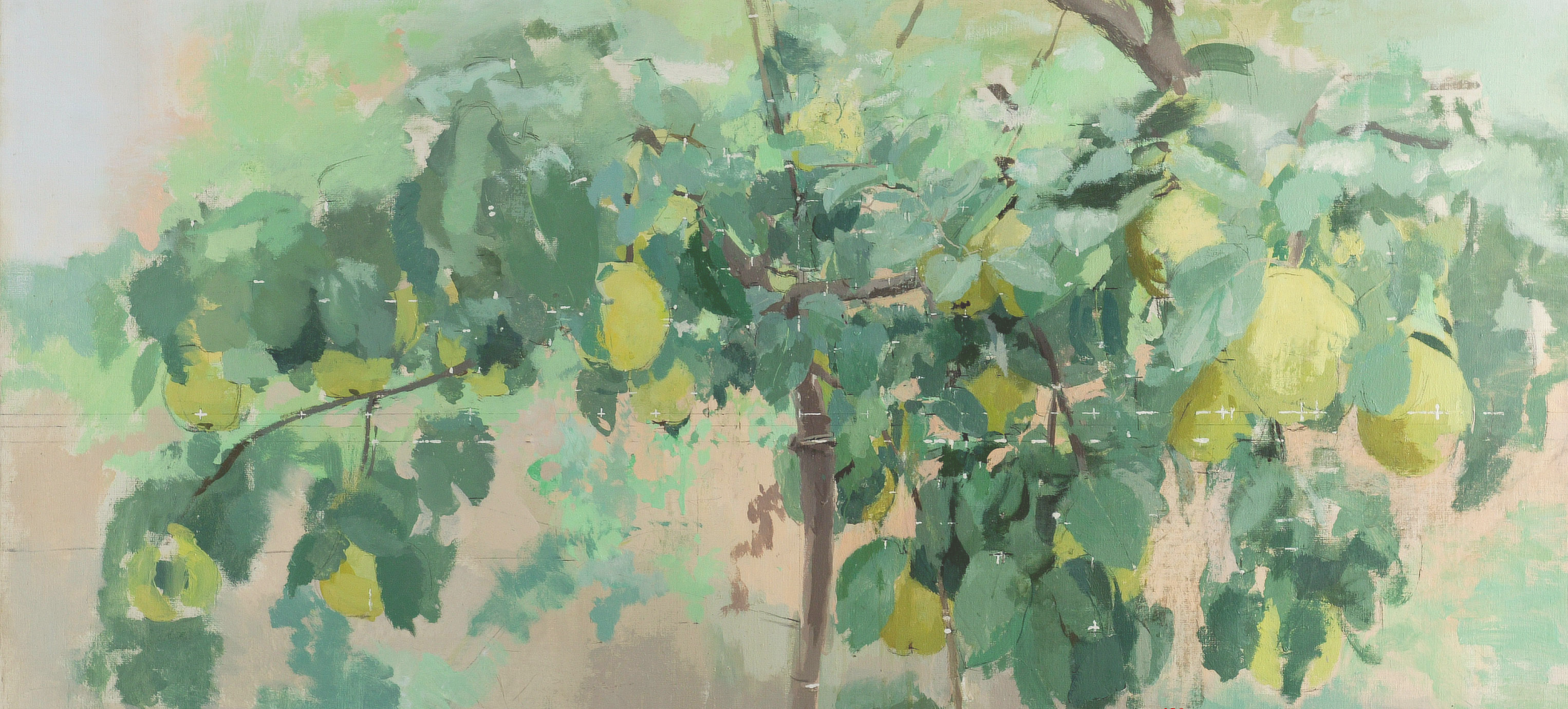
Membrillero. Antonio López, 1990

El quid de la cuestión reside en que el alumno encuentre su espacio. Lo único que hay que hacer, si sabes, es ayudar a encontrar ese espacio que le corresponde a cada uno.