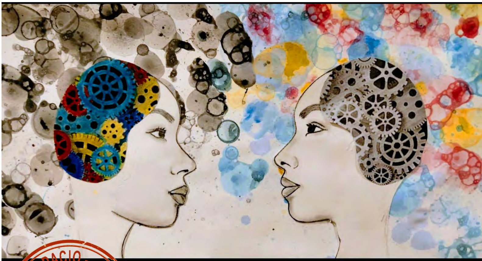
Ilustración: Goya Román